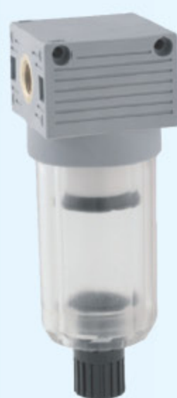
T010 MINI - FILTR