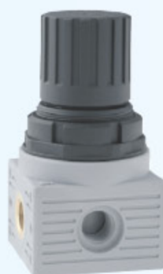
T020 MINI - REGULÁTOR