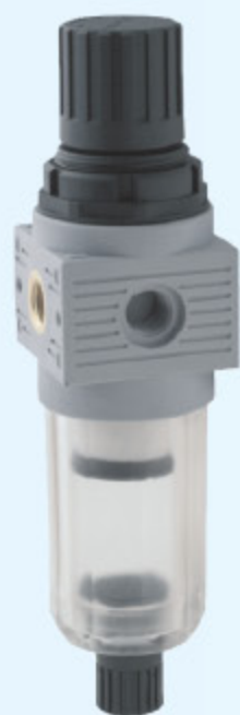
T030 MINI - FILTR + REGULÁTOR