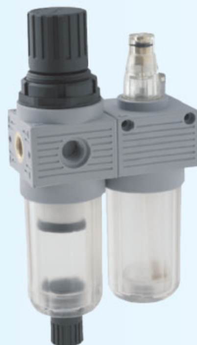
T100 MINI - FR + L