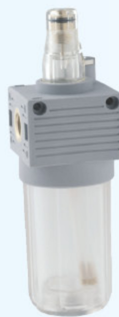
T040 MINI - LUBRIKÁTOR