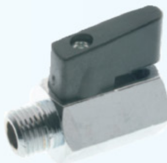
6066 - MINI KULOVÝ KOHOUT