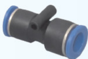
SPOJKA PŘÍMÁ PG-R