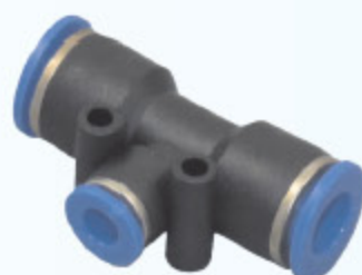
SPOJKA T-R PGT