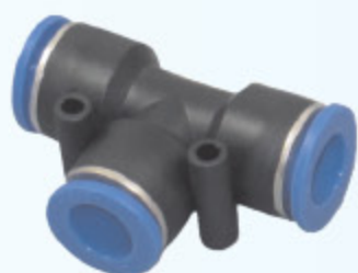
SPOJKA T PUT