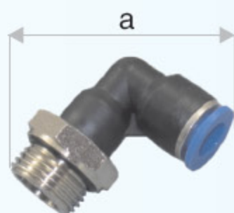
PŘÍPOJKA KOLENO PL