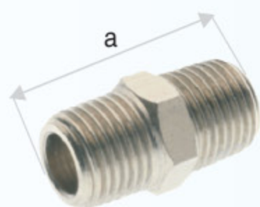
2000 - NIPL AR