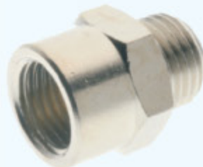
2050 - VSUVKA IG-AG