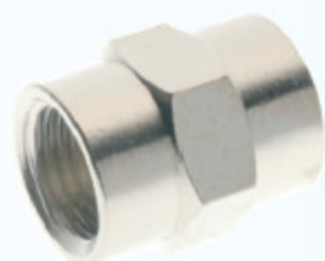
3000 - NIPL IG