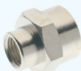
3010 - NIPL IG