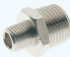
2020 - NIPL AR