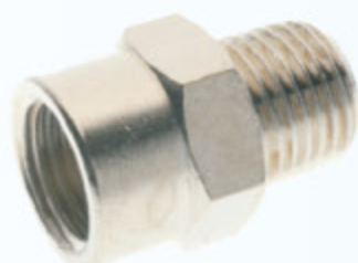
2040 - VSUVKA IG-AG