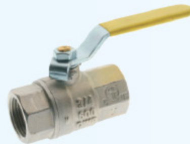
6068 - KULOVÝ KOHOUT