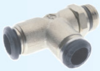
50223N - SPOJKA T