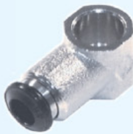
50500N - PRŮTOKOVÉ OKO