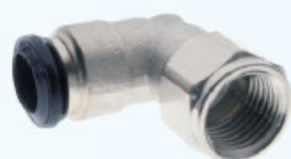
50106N - ŠROUBENÍ L 90°