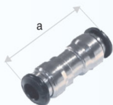
50040N - SPOJKA PŘÍMÁ