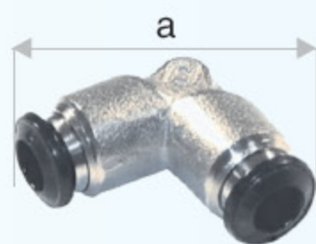
50130N - SPOJKA L 90°