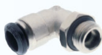
50116N - ŠROUBENÍ L 90°