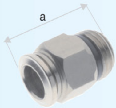
57000 - PŘÍPOJKA PŘÍMÁ