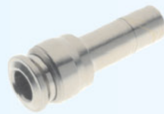
57700 - REDUKCE