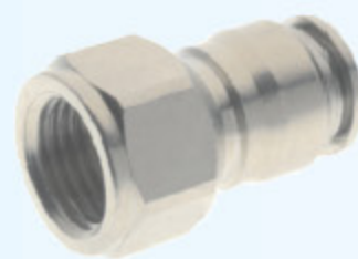
57030 - PŘÍPOJKA PŘÍMÁ