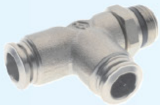
57223 - SPOJKA T