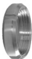
DRINTEX CAP MB