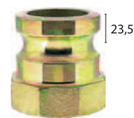
System 23.5 (jen rozměry 35 a 50!)