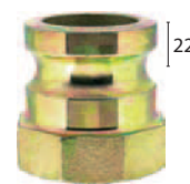
System 22 (pro všechny rozměry)