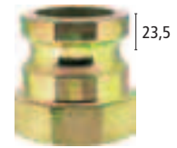
System 23,5 (nur bei Typgrößen 35 und 50!)