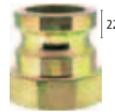
System 22 (für alle Typgrößen)